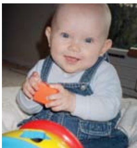
Leikfangaleiga er kannski það sem koma skal

út leikföng fyrir börn á aldrinum 0-5 ára. Í dag fá um 200 félagar „ný“ leikföng send heim að dyrum einu sinni í mánuði. Leikföngin eru framleidd án skaðlegra efna og standast gæða- og öryggiskröfur. Þá eru þau hreinsuð með umhverfisvænum hreingingarefnum eftir að leigutíma hvers viðskiptavinar lýkur. Slíkar leigur þekkjast einnig í Bretlandi og Ástralíu og á Nýja Sjálandi.