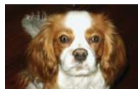
Þess er kannski ekki langt að biða að hægt verði að leigja hund hér á landi

Það getur verið bindandi að eiga hund en nú er hægt að leigja hund í nokkra tíma eða jafnvel í nokkra daga hjá fyrirtækinu Flexpets.com. Þessi þjónusta er þó aðeins í boði í nokkrum borgum í Bandaríkjunum og í London og París. Hundarnir eru þrífallegir að sögn fyrirtækisins og hafa allir farið í gegnum hundaskóla þess. Ýmislegt annað er til leigu úti í hinum stóra heimi, svo sem vénekrur, fatnaður fyrir þungaðar konur, smábarnaföt úr lífrænt ræktaðri bómull, bátar og stafrænar myndavélar.